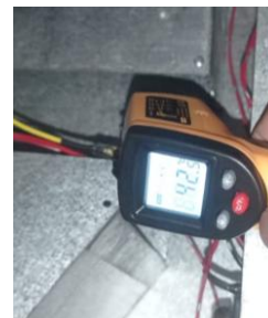
Gambar 4. Pengukuran temperatur menggunakan thermogun

Proses validasi hasil pengukuran dengan menggunakan thermogun untuk mengetahui besarnya temperatur pada permukaan plat seperti yang ditunjukkan pada gambar 4.