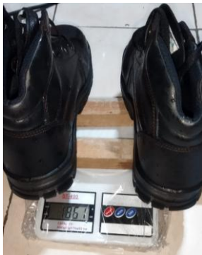
Gambar 2. Penimbangan berat sepatu

Pengujian diawali dengan mempersiapkan mesin pengering sepatu. Sebelum pengujian dilakukan, penting untuk melakukan pengecekan temperatur dan keamanan mesin kemudian dilanjutkan dengan pendataan berat sepatu kering dan berat sepatu basah untuk mengetahui kadar air yang terdapat pada sepatu. Sepatu yang akan diuji sebelumnya direndam terlebih dahulu, dan sedikit ditiriskan sampai tidak ada tetesan air yang keluar, kemudian dilakukan pengukuran berat awal sepatu, dilanjutkan dengan pengaturan timer (waktu pengeringan) pada 30, 60, dan 90 menit seperti yang ditunjukkan pada gambar 2. Setelah waktu tercapai, catat berat sepatu yang dihasilkan dari masing-masing variasi waktu. Temperatur pada titik pengukutan dicatat menggunakan digital display . Temperatur ruangan pengering sepatu disetting konstan yaitu sebesar 70^{\circ}\text{C} untuk menghindari kerusakan bahan.