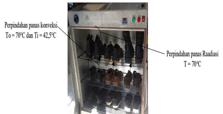
Gambar 3. Penentuan titik pengukuran

Proses validasi hasil pengukuran dengan menggunakan thermogun untuk mengetahui besarnya temperatur pada permukaan plat seperti yang ditunjukkan pada gambar 4.