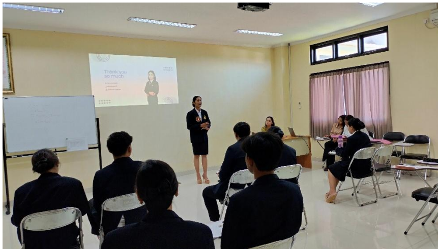
Gambar 2. Kegiatan simulasi public speaking peserta selama sesi praktik pelatihan

Selain itu, hasil pengukuran kuantitatif terhadap kemampuan peserta sebelum dan sesudah pelatihan yang ditampilkan pada Tabel 1 dan Gambar 3 menunjukkan adanya peningkatan pada seluruh aspek keterampilan public speaking peserta.