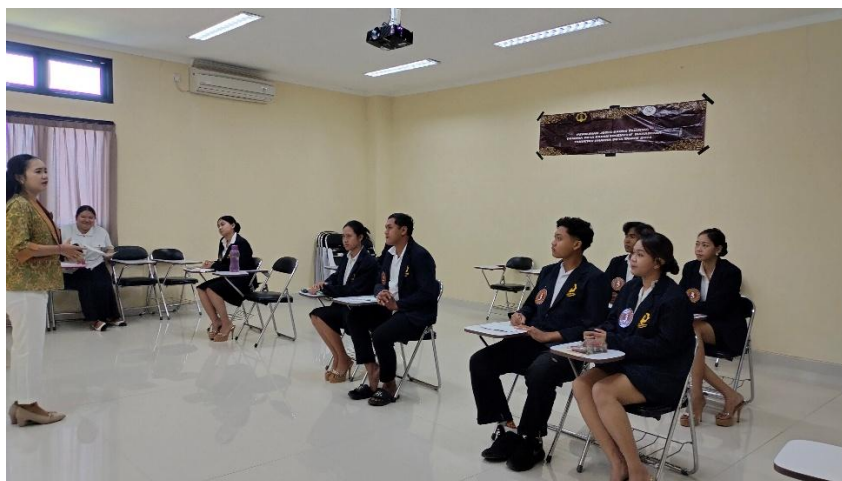
Gambar 1. Kegiatan penyampaian materi public speaking oleh narasumber kepada peserta pelatihan

Pada tahap demonstrasi, narasumber terlebih dahulu menampilkan contoh praktik public speaking secara langsung dengan membawakan topik tertentu menggunakan struktur yang runtut dan teknik penyampaian yang baik. Demonstrasi ini mencakup cara membuka pembicaraan yang menarik, menyampaikan isi secara jelas dan sistematis, serta menutup dengan kesan yang kuat. Setelah itu, beberapa peserta diminta untuk mencoba melakukan praktik singkat di depan kelompok dengan bimbingan langsung dari narasumber. Selama proses ini, narasumber memberikan arahan secara real-time terkait posisi tubuh, penggunaan suara, pengelolaan jeda, serta interaksi dengan audiens. Pendekatan ini memungkinkan peserta tidak hanya memahami materi secara teoritis, tetapi juga melihat contoh konkret sekaligus mempraktikkannya secara langsung dalam suasana yang terarah dan suportif. Dokumentasi kegiatan penyampaian materi dan simulasi public speaking ditampilkan pada Gambar 1 dan Gambar 2.