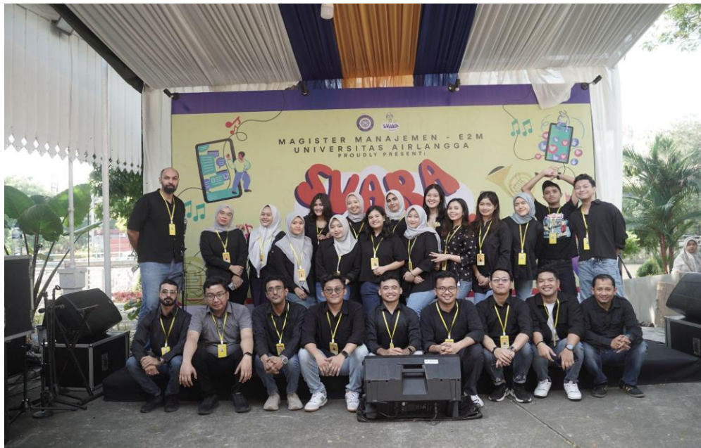
Gambar 2. Dokumentasi mahasiswa E2M sebagai panitia