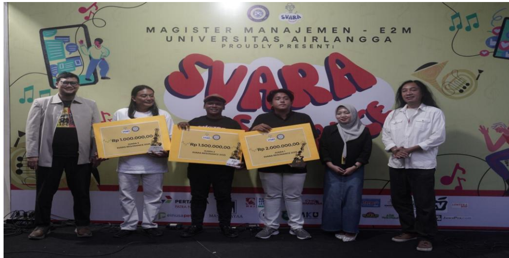
Gambar 1. Penyerahan penghargaan kepada musisi jalanan yang berbakat